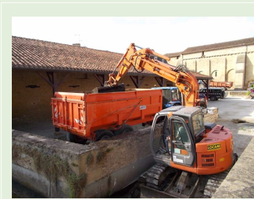
Pressac, sept. 14