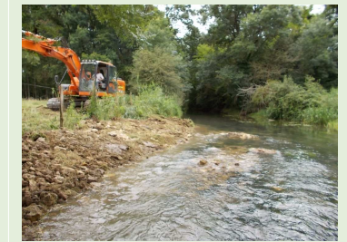
Château Garnier, juin 14