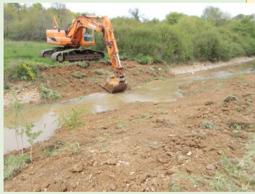
Mémageon avril 14

bl_12_01 Restauration hydromorphologique de la Bouleure (env. 200 m3 de pierre avec participation d'habitants)