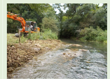
Château Garnier, juin 14