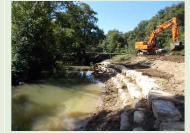
Château Garnier, sept. 14