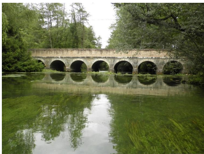
Pont de Says

Nous restons à votre disposition, n'hésitez pas à nous signaler les points à améliorer et vous pouvez consulter le site internet du syndicat pour en savoir plus clainsud.fr . Un autre site internet à consulter pour avoir des informations au niveau du bassin du Clain : sageclain.fr . Le SAGE Clain (Schéma d'Aménagement de Gestion de l'Eau) défini par des diagnostics les enjeux sur le bassin versant. En cours d'élaboration, il regroupe les enjeux quantitatifs, qualitatifs et les milieux aquatiques pour définir les orientations et ceux avec tous les usagers.