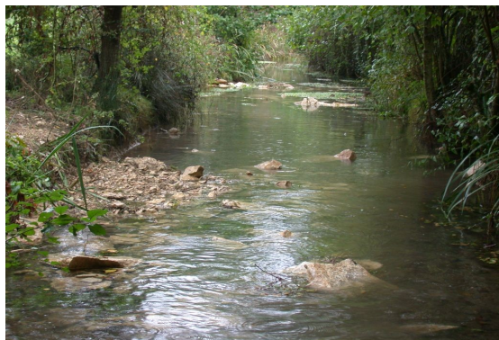
Aménagement sur l'Arquetan (déflecteurs à gauche pour dévaser le cours d'eau)

Le Syndicat Mixte du Clain Sud entretient les rivières depuis 7 ans sur le Clain amont de Pressac à Voulon et sur ces affluents les plus importants. Cette année, environ 25 km de rivière (en jaune vif sur la carte) ont fait l'objet d'un entretien ou d'une restauration.