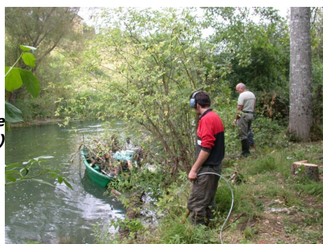
Cablage d'un arbre sur le Clain (aval de Commenjard)

Dans un objectif de « développement durable », un Contrat de Restauration Entretien (CRE) a été signé avec l'Agence de l'eau Loire Bretagne. Ce contrat (2008-2012) concerne des interventions sur le Clain en aval de Pressac vers St Martin ainsi que la création et restauration de frayères à brochet à Anché et Château Garnier.