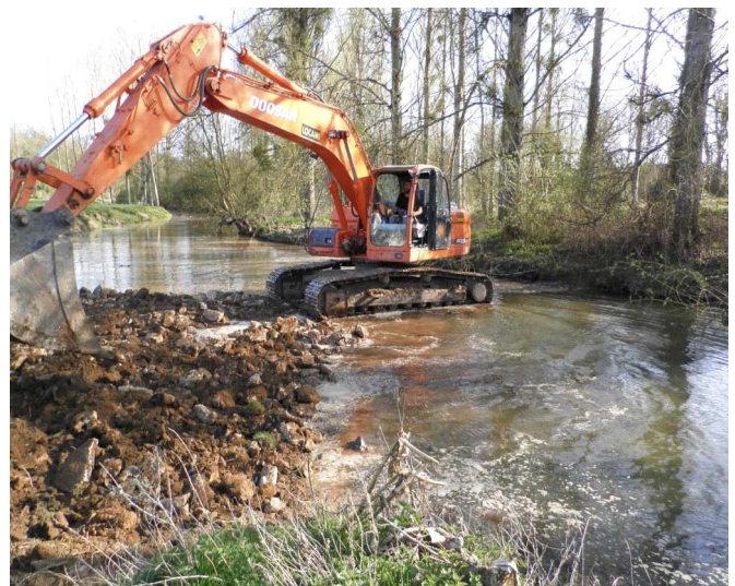
Photo préférentielle : n° photo : dv_300312_45 prise le : 30/03/12